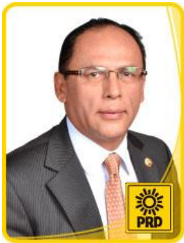
Dip. Saúl Benítez Avilés.